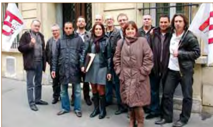
"Les élus Boulanger et Saturn, unis, veillent aux grain dans le cadre du rachat".

Mais le monde ouvrier bouge et pas seulement en France. Et nous souhaitons que les conditions de travail des ouvriers, notamment du textile, de Chine, de Thaïlande, de Birmanie et du Bangladesh s'améliorent, que leur salaire augmente ; mais aussi qu'ils puissent s'organiser sans craindre pour leur vie. Cela permettra aux vendeurs de chez ZARA, H&M, CAMAIEU, pour ne citer que ces enseignes, de vendre des produits qui ne sont pas entachés de la misère et de la souffrance des travailleurs. Au Bangladesh, quatre d'entre eux sont morts et de nombreux autres ont été blessés pour avoir réclamé une augmentation de salaire qui leur était due mais non versée. Cette augmentation portait leur salaire à 30 € par mois. Nous laissons aux Camarades qui militent dans la branche de l'habillement, le soin de voir ce que cela représente en nombre de pièces vendues.